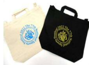
オリジナルトートバック