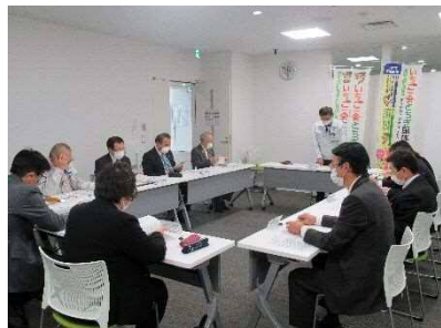
庁内推進本部会議