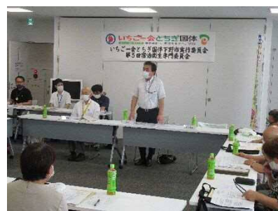
宿泊衛生専門委員会（篠崎委員長）