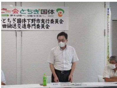
輸送交通専門委員会（荒川委員長）