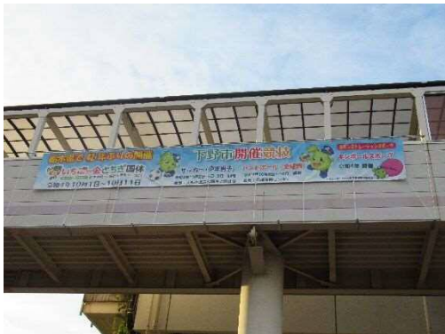
J R 自治医大駅駐輪場連絡橋