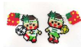
ビーズキーホルダー