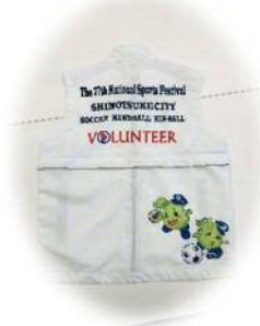
ボランティアユニフォーム