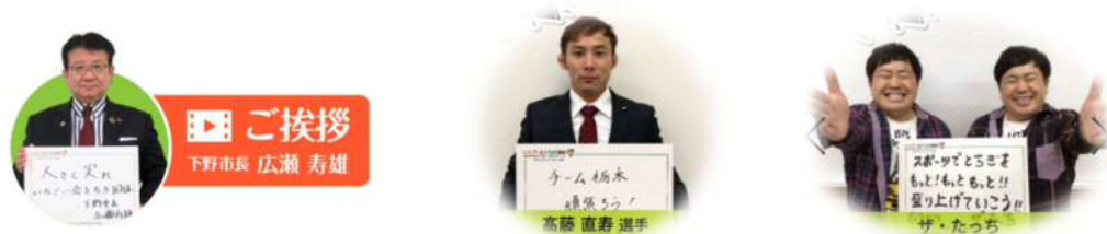
市長の歓迎メッセージやエール大使のメッセージが動画で見られます