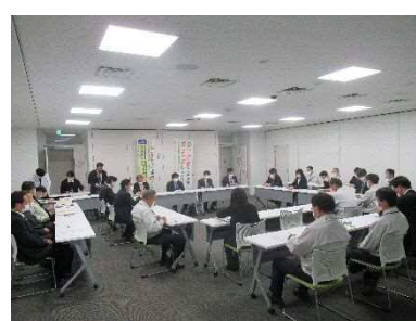
庁内推進本部幹事会