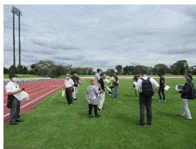
競技会場視察（大松山運動公園陸上競技場・石橋体育センター）