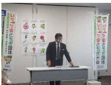
庁内実施本部会議