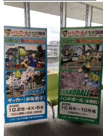
オリジナルバナースタンド