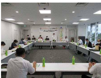
競技式典専門委員会（金島委員長）