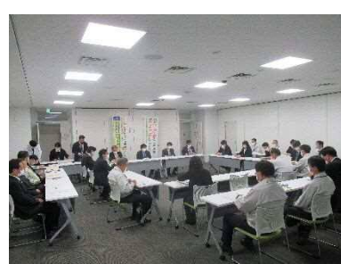
庁内推進本部幹事会