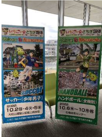
オリジナルバナースタンド