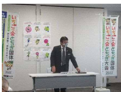
庁内実施本部会議