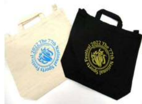
オリジナルトートバック