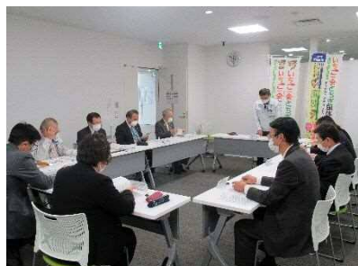
庁内推進本部会議