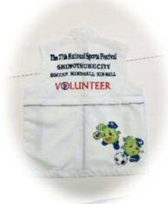
ボランティアユニフォーム