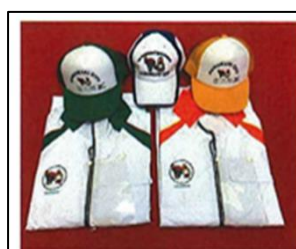
スタッフジャンパー・帽子