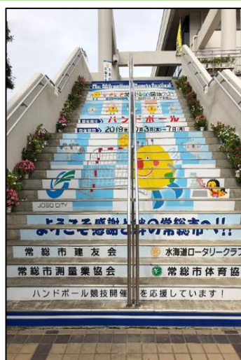
ウォールステッカー

* 物品等については、搬入・据付・撤去などに要する費用を含めた協賛をお願いします。